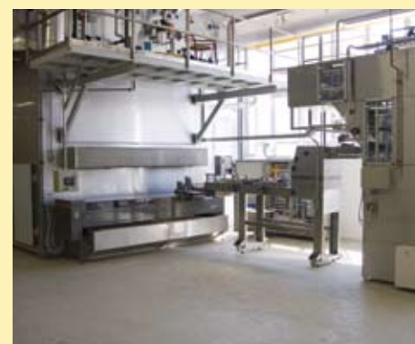
▶ пример размещения шкафа IK

Дополнительную информацию можно получить, позвонив по тел. +386 5 33 07 100 или выслав сообщение на info@gostol-gopan.si